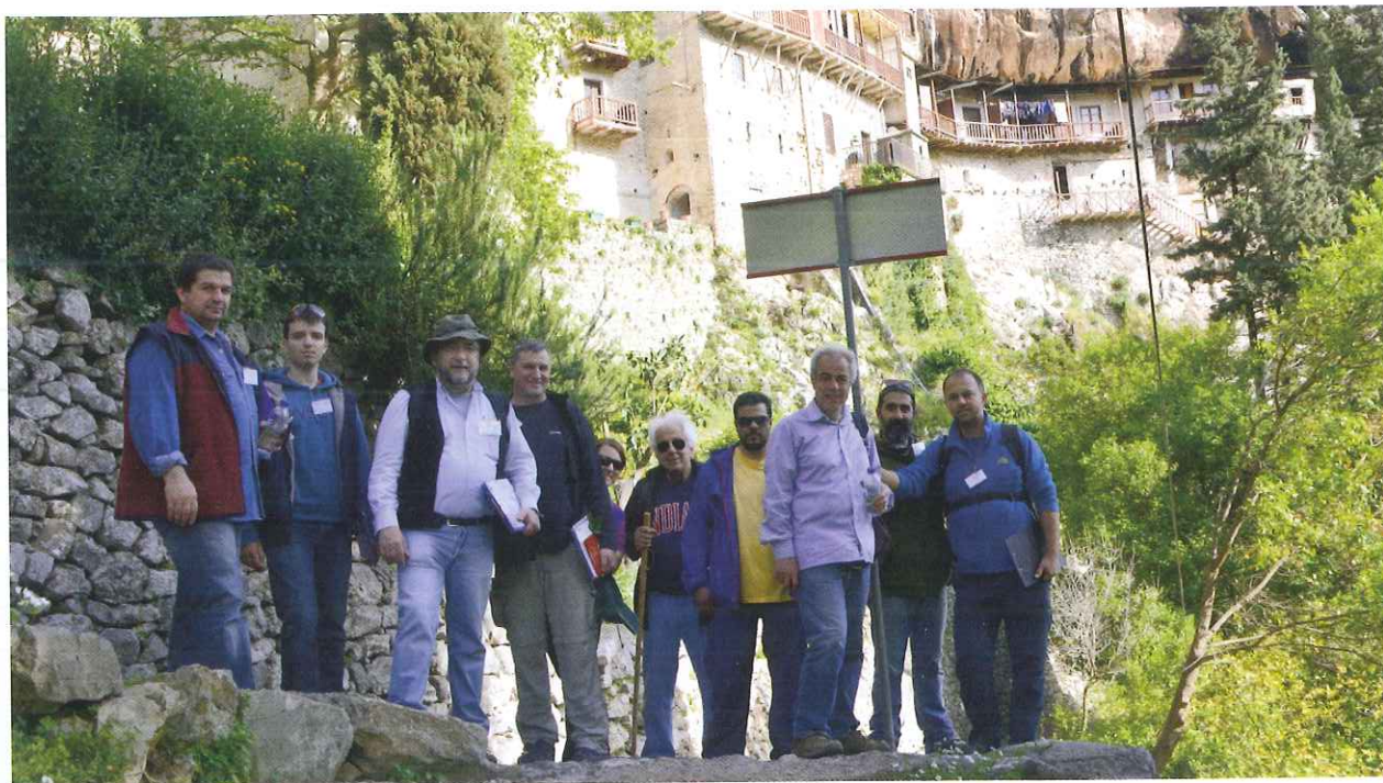
Πίστεψαν σε μια καλή ιδέα, εργάστηκαν συντονισμένα, έκαμψαν αμφισβητήσεις και γραφειοκρατία και κάνουν την διαφορά στον τόπο τους. Οι... «10 του Μαινάλου» είναι παράδειγμα φωτεινό.